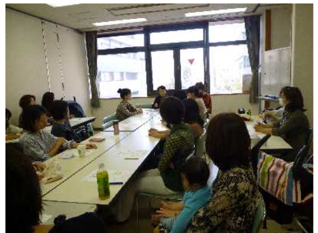
子育て応援セミナーの様子

今の時代は外にでなくてもいろいろな情報が手に入りますが子どもに対する自分の気持ちや言動の一つ一つに不安や迷いはなくなるものではなく、それでも一生懸命育児に取り組んでおられる若いおかあさん方と接することができます。次回また精一杯させてもらおうと元気をもらいました。(桐山)